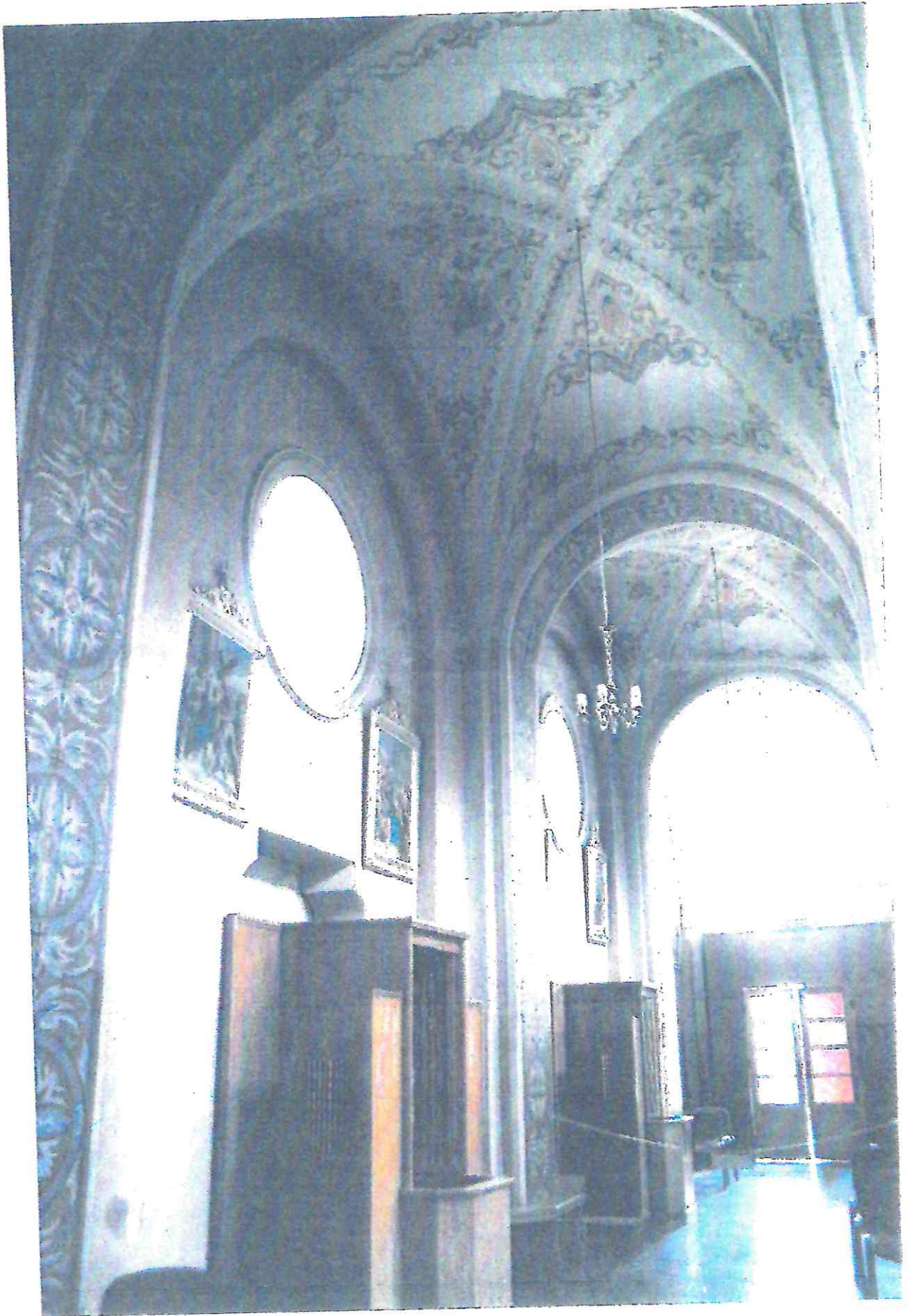
KRYPNO, KOŚCIÓŁ PW NARODZENIA NMP. NAWA BOCZNA